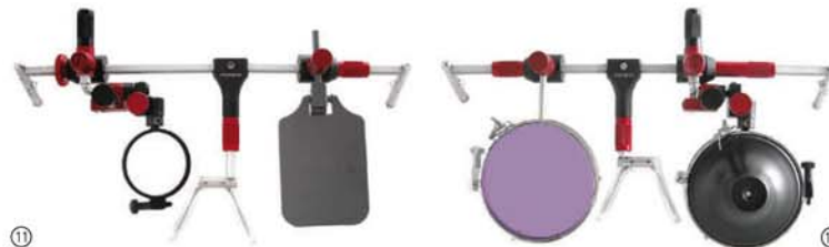
Bild 11: Gewehr, rechts, 25 mm Bild 12: Pistole, links, 42 mm, mit Einstelltrichter und ACE-Filter

Ein technisches Wunderwerk – alle Einstellungen der Zieleinheit können ohne Werkzeug im Anschlag über zwei verschiedene Winkelgetriebe vorgenommen werden. Der Steg ist seitlich versetzt. Ansonsten wie Olympic-Modell. Die ideale Brille für Gewehr- und auch Pistolenschützen, die die technische Perfektion lieben. Diese Brille besteht aus 96 Einzelteilen!