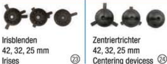
Irisblenden 42, 32, 25 mm Irises 23 Zentriertrichter 42, 32, 25 mm Centering devices 24