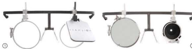
Bild 1: Pistole, 42 mm, mit Korrekturglas links und Abdeckung Bild 2: Gewehr, 25 mm, mit Iris und Graufilter

Die Einstellung der Zieleinheit, hier bestehend aus je einem Stellschieber, Vertikalstift, Ringhalter und Augenrand erfolgt mit Hilfe eines Inbusschlüssels.