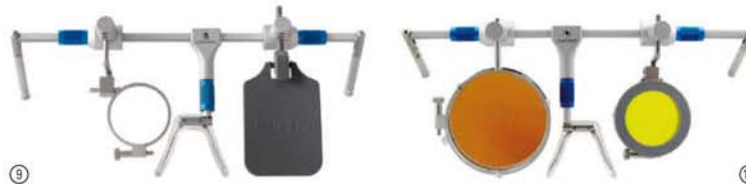
Bild 9: Gewehr oder Bogen, rechts, 25 mm, spezielle Höhe Bild 10: Gewehr oder Bogen, links mit Magnetclip-System gelb und Orangefilter

Zusätzlich zu den Eigenschaften der OLYMPIC CHAMPION Brille kann der Nasensteg, um extreme Zieltechniken über den Nasenrücken zu ermöglichen, individuell nach links oder rechts auf einer Gewindestange aus der Visierlinie verschoben werden.