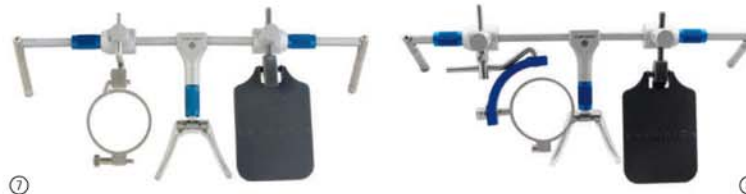
Bild 7: Gewehr, blau, 25 mm Bild 8: Gewehr mit Schnellwechselsystem für den Dreistellungskampf

Die Feineinstellung der Zieleinheit, bestehend aus Vertikalstift, Ringhalter und Augenrand kann in Anschlagposition mittels Rändelmuttern ohne Werkzeug durchgeführt werden. Dies gilt auch für die Veränderung der Steghöhe und -breite sowie der Bügellänge. Das geringe Gewicht und die Federscharniere der Bügel sorgen für optimalen Tragkomfort.