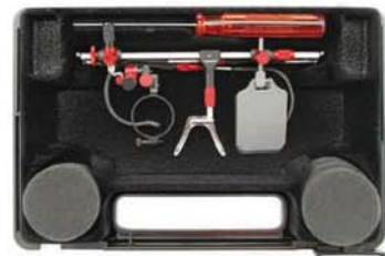
Superolympic im Etui für Gewehr Superolympic in case for rifle 13