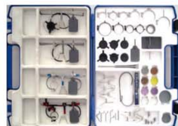
Demokoffer für Händler mit den wichtigsten Zubehörteilen Demo-kit for dealers with most of the important parts 22