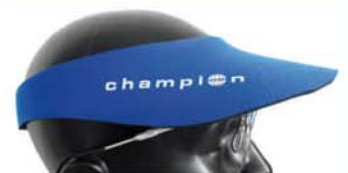
Champion Visor aus Neopren mit Klettverschluss Champion Visor made out of neopren with velcro 19