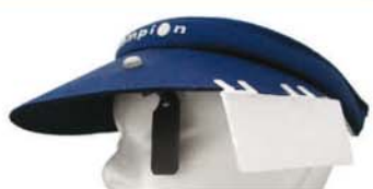
Schützenschild mit diversen Abdeckungen Sunshield with various shields 20