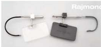
World-Modelle Olympic-Modelle ISSF-Seitenblende, transparent und grau ISSF-Sideblinders, transparent and grey 18