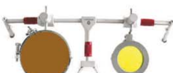
Gewehr, rot, mit Magnet-, Gelb- und Orangetfilter Rifle, red, with magnetic, yellow and orange filter 16