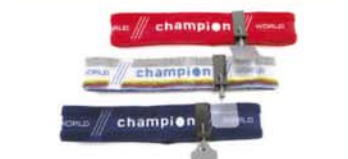
Stirnbänder mit diversen Abdeckungen Headbands with various shields 17