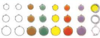
Diverse Farbfilter, 42, 32 und 25 mm Magnetfiltersystem (nur 25 mm) Colored filters and magnetic filter system 21