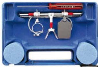
Olympic im Etui für Gewehr Olympic in case for rifle 14