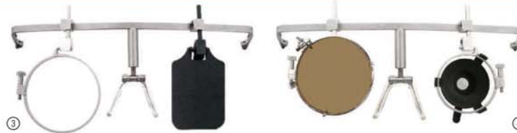
Bild 3: Pistole, 42 mm Bild 4: Gewehr oder Pistole, 32 mm, mit Iris und Braunfilter

Mit verstellbarer Steghöhe und individuell anpassbarem Silikonnasensteg sowie Silikonbügelüberzügen für optimalen Tragkomfort.