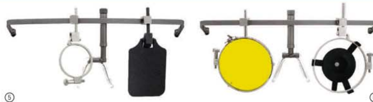
Bild 5: Gewehr, 25 mm, mit versetztem Steg rechts Bild 6: Pistole, 42 mm, mit Iris und Gelbfilter

Mit einem im Anschlag ohne Werkzeug höhenverstellbarem Nasensteg. Federscharniere an den Bügeln sorgen für einen optimalen Tragkomfort. Für extreme Anschlagpositionen wird dieses Modell auch mit nach links oder rechts versetztem Nasensteg geliefert. Speziell geeignet für Bogenschützen und Stehendanschlag.